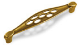
Mod. 1029 Interasse 128 mm - Finitura Bronzo cod. W101