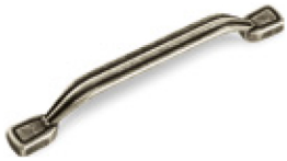
Mod. 9-1361 Interasse 128 mm - Finitura Argento cod. W105