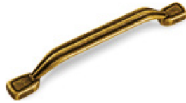
Mod. 9-1361 Interasse 128 mm - Finitura Bronzo cod. W102