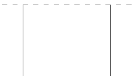
2,4 cm Scala | Scale 1:1