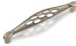
Mod. 1029 Interasse 128 mm - Finitura Argento cod. W104